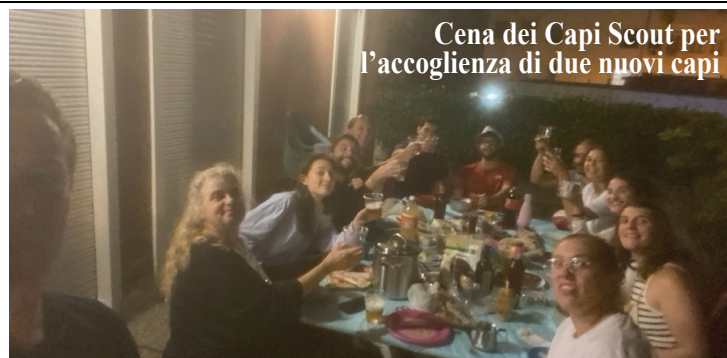
Cena dei Capi Scout per l'accoglienza di due nuovi capi