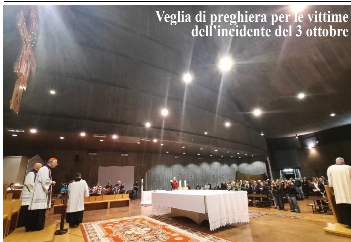
Veglia di preghiera per le vittime dell'incidente del 3 ottobre